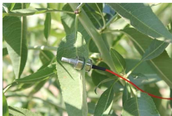
Figura 1. Instalación de sensores de humedad y turgencia