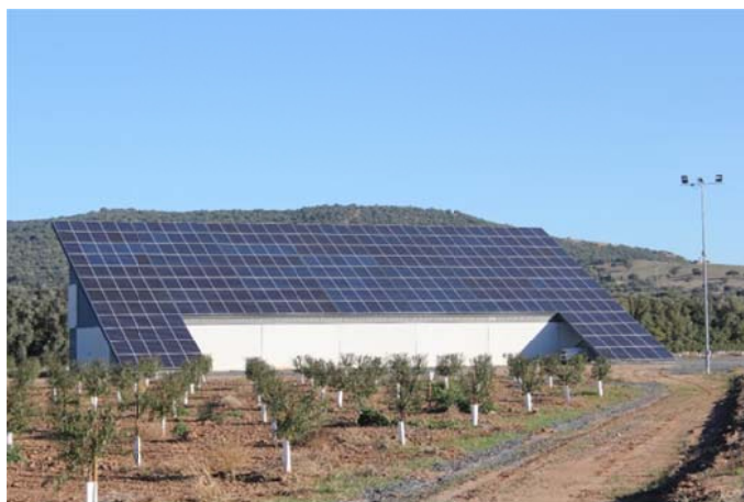
Figura 2. Instalación de riego fotovoltaico

Todo esto es la base de un riego sostenible, inteligente y de futuro. Las soluciones tecnológicas están ya disponibles, y un nuevo campo de oportunidades se nos abre para optimizar la relación entre el agua y la energía.